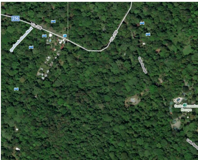
Mapka ukazující vznikající zástavba v místě tečky ●