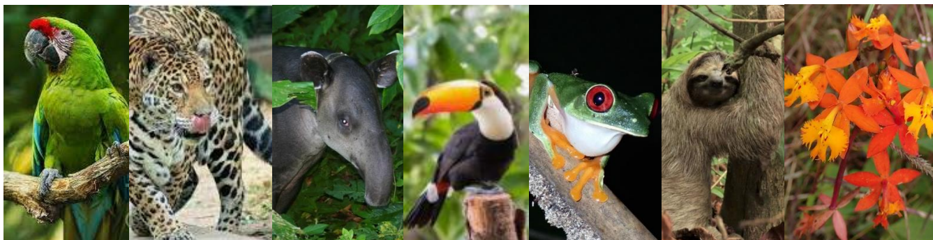
... druhy žijící v Chráněném lesním parku Gandoka - Manzanillo

Přestože Kostarika patří mezi aktivní v péči o přírodu, není vyhráno!