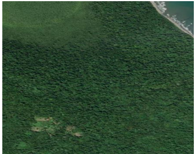
a nezákonnou likvidace pralesa v místě tečky ●